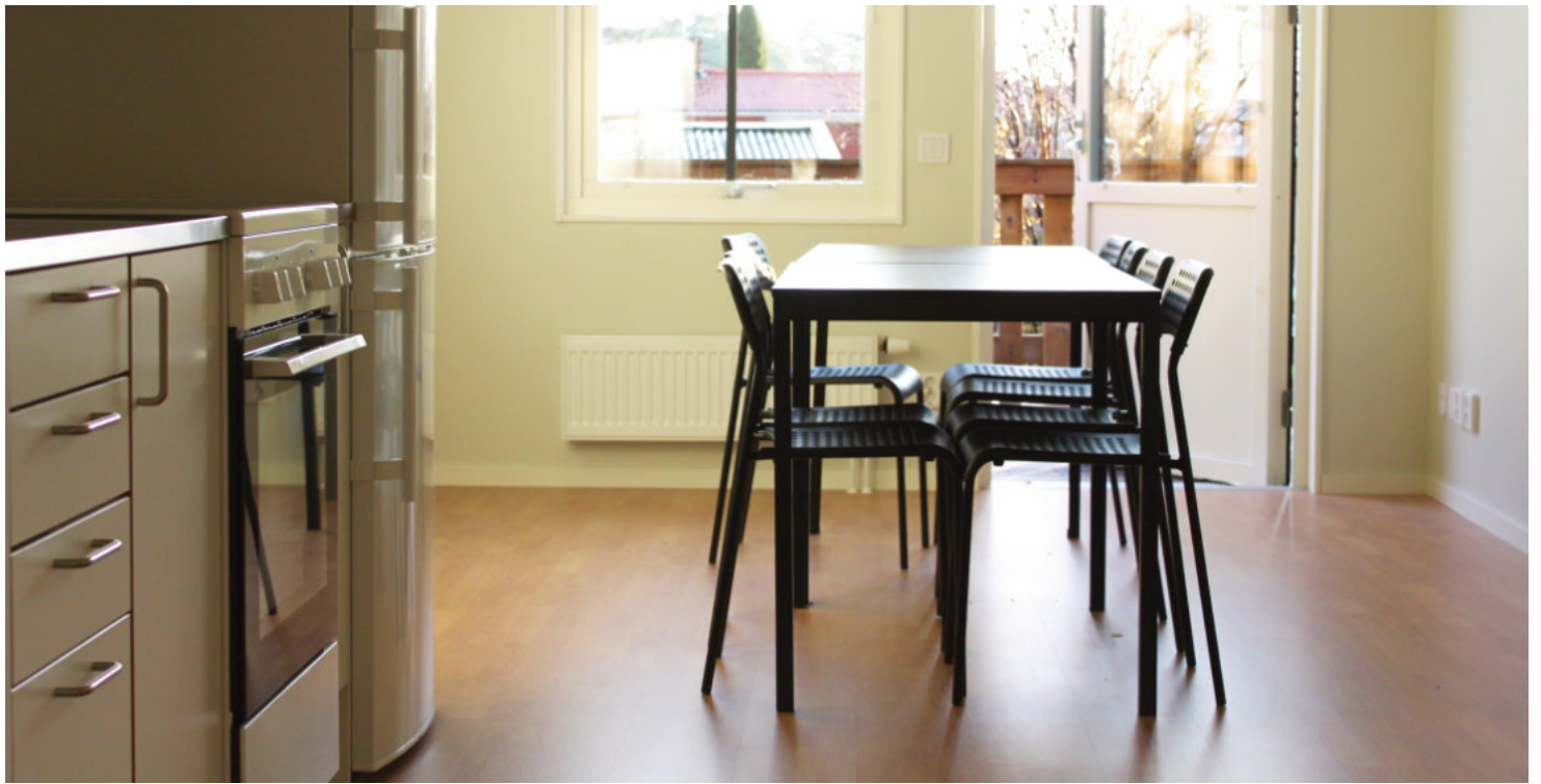
Kök och vardagsrum i en av lägenheterna. Från vardagsrummet finns en dörr ut till sin egen uteplats.