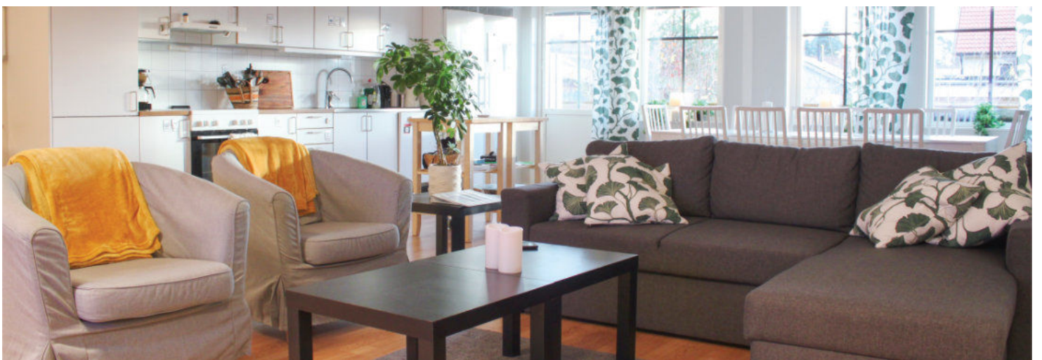
Gemensamhetsyta – vardagsrum, kök och matrum.

stödbehov, öka självständighet och stärka självkänslan. För att öka motivation och delaktighet i vardagen har vi boendemöten en gång i månaden tillsammans med de boende. Där får de bland annat komma med förslag på vardag-, helg- och sommaraktiviteter. Där finns också möjlighet för de boende att lyfta andra frågor och önskemål såsom till exempel inköp och mat.