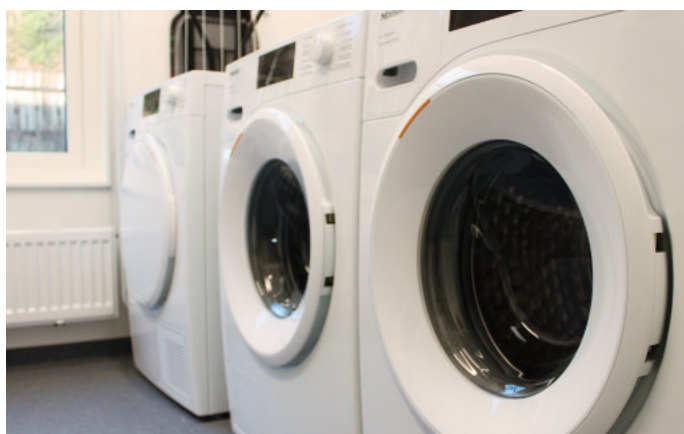
I tvättstugan kan de boende få stöd av personal samt ta del av det bildstöd som finns framtaget för sortering av tvätt.