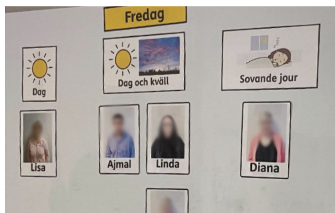
Namn och bild på dag-, kväll- och nattpersonal sitter alltid uppe. De boende vet alltid vilka som arbetar, och när.