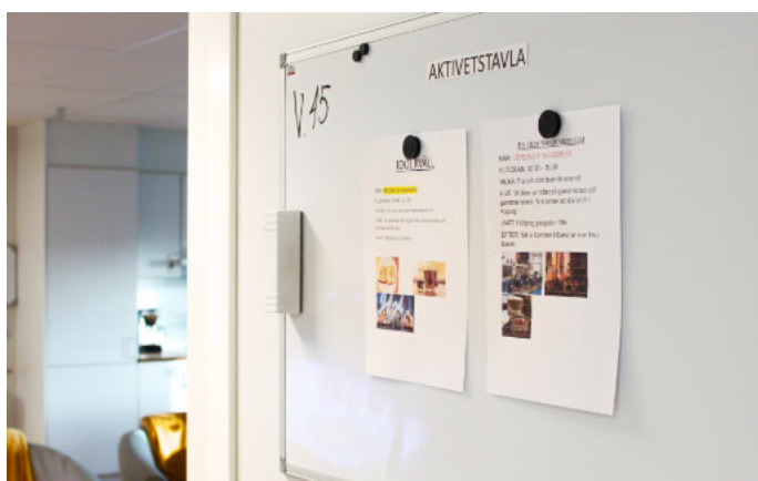
Helgens planerade aktiviteter finns alltid att se i hallen med bild och lättläst text. Det skapar motivation och förutsägbarhet.

Målet är att skapa förutsättningar för den enskilde att bli så delaktig och självständig som möjligt i olika situationer och aktiviteter genom livet.